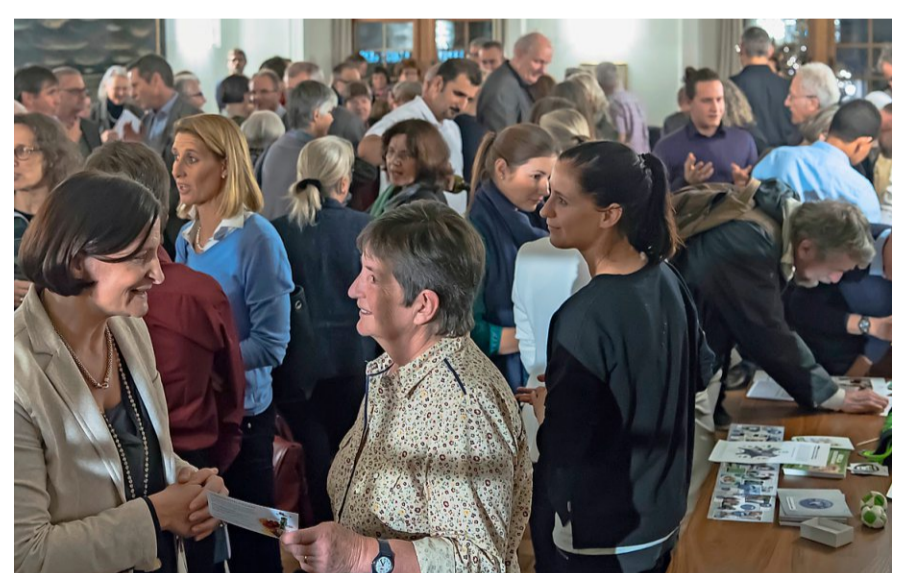
Im November 2016 wurden 10 Jahre Spendenparlament gefeiert.

Grundsätzlich müssen die Projekte fünf Kriterien erfüllen: Es muss sich um ein Projekt handeln, das einen Beitrag leistet zur Bekämpfung von Armut, gesellschaftlicher Isolation oder Ausgrenzung. Es muss sich auf den Kanton Zürich konzentrieren, muss gemeinnützig sowie politisch und konfessionell neutral sein. Zudem darf es nicht mehr als zu einem Drittel von der öffentlichen